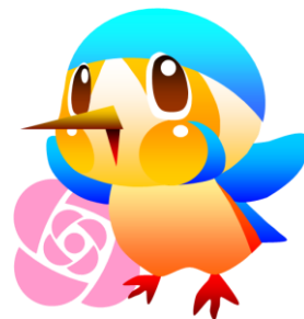
市のマスコットキャラクター「あやびい」