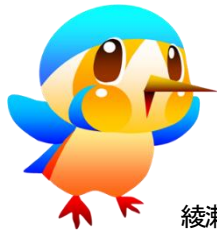
綾瀬市のマスコットキャラクター あやびい

綾瀬市では、職員のワークライフバランスの向上のために働き方改革に取り組んでいます。