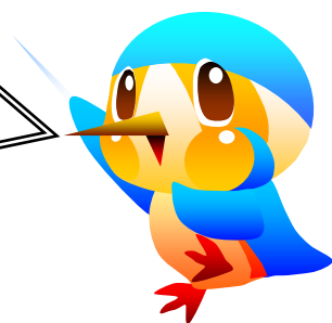
市のマスコットキャラクター あやびい