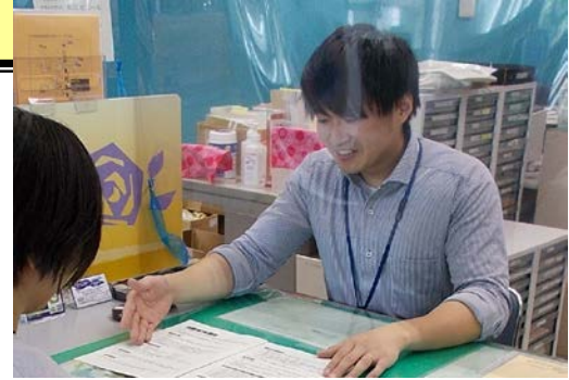
窓口で説明をしている様子