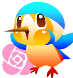
市のマスコットキャラクター「あやびい」

綾瀬市では、令和3年4月からフレックスタイム制度(コアタイムなし)を開始しています! 詳しくは最後のページをご覧ください。