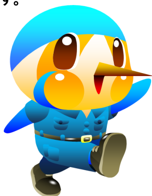
綾瀬市マスコットキャラクター あやびい

「持続的な成長・発展を続けられるまち」であるために次のことを意識し、実践します。